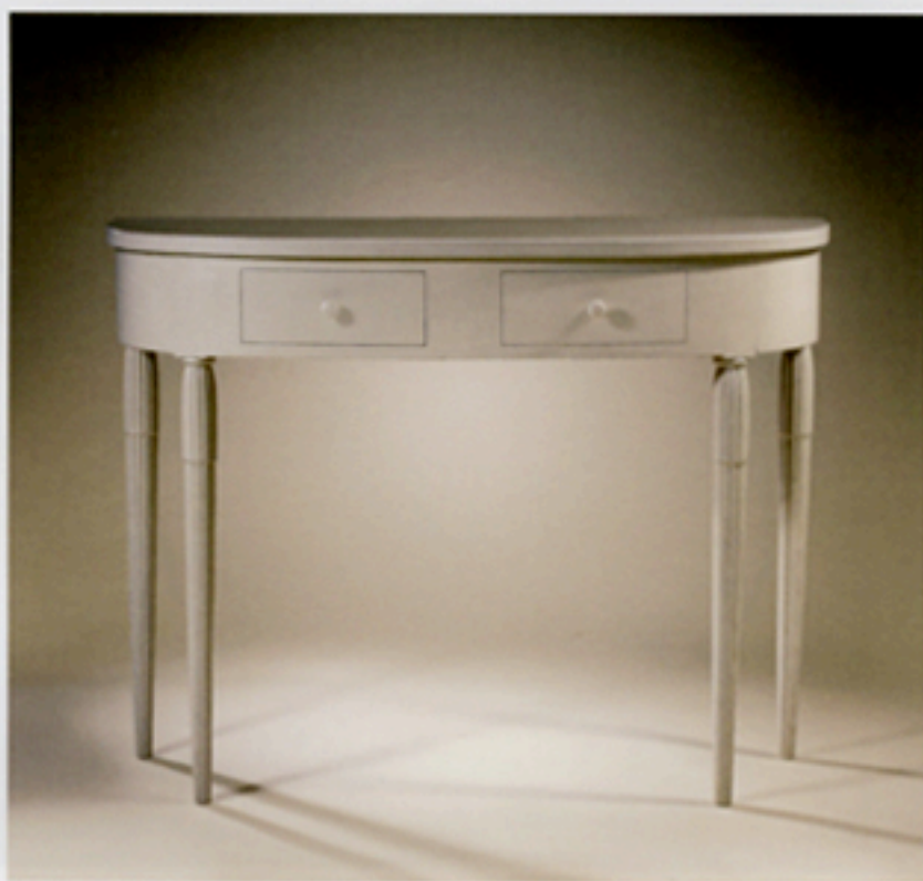
Armand-Albert Rateau (1882-1938) Console Bois laqué gris-beige, vers 1921 Paris, Galerie Mothivert

Les courants sociaux dans lesquels commencent à se mouvoir les classes les plus modestes donnent à ces dernières une ouverture sur les loisirs, ainsi que la prétention à un confort duquel, et c'est l'apport majeur de l'Art Déco, l'art n'est pas exclu : poêles à charbon, postes de radio, pendules, tables à ouvrage, salles à manger complètes, armoires de chambre reçoivent ainsi d'élégants décors stylisés, inspirés des meilleurs créations en vogue.